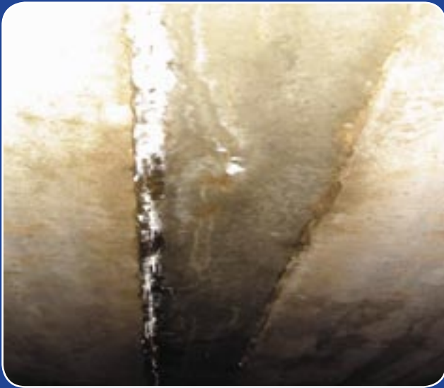
Druskų varvekliai stalaktitai požeminiame garaže...