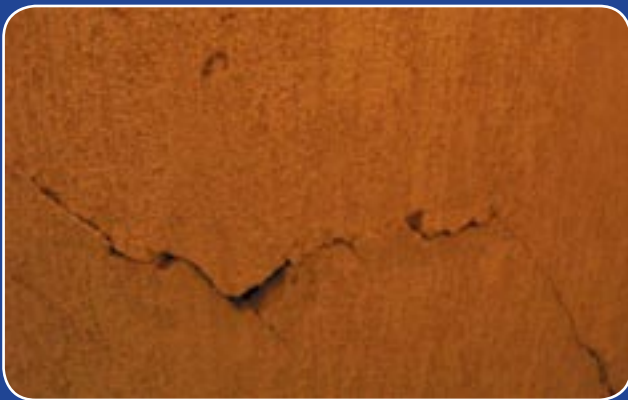
Pertrūkusios denginių plokštės...

ieškoti pinigų būsto remontui. Nes šio niekalo gamintojų pėdos jau seniai ataušiosios – čia dirbo UAB „Vusta“, UAB „Baltijos ažuolas“, UAB „Mablita“ statybininkai. Nespėjus atslūgti naujakurių džiaugsmui, butų savininkai jau kvaršina galvas dėl akis badančių ir vis naujai išlendančių defektų. Nerimauja prieš kelerius metus UAB „Vusta“ pastatyto gyvenamųjų namų komplekso savininkai, ne kiek didesnė sėkmė lydi plačiai nuskambėjusį butų savininkų ir UAB „Verkių statyba“ konfliktą.