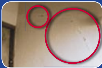
Įtrūkimai sienose ir jų pamatuose...